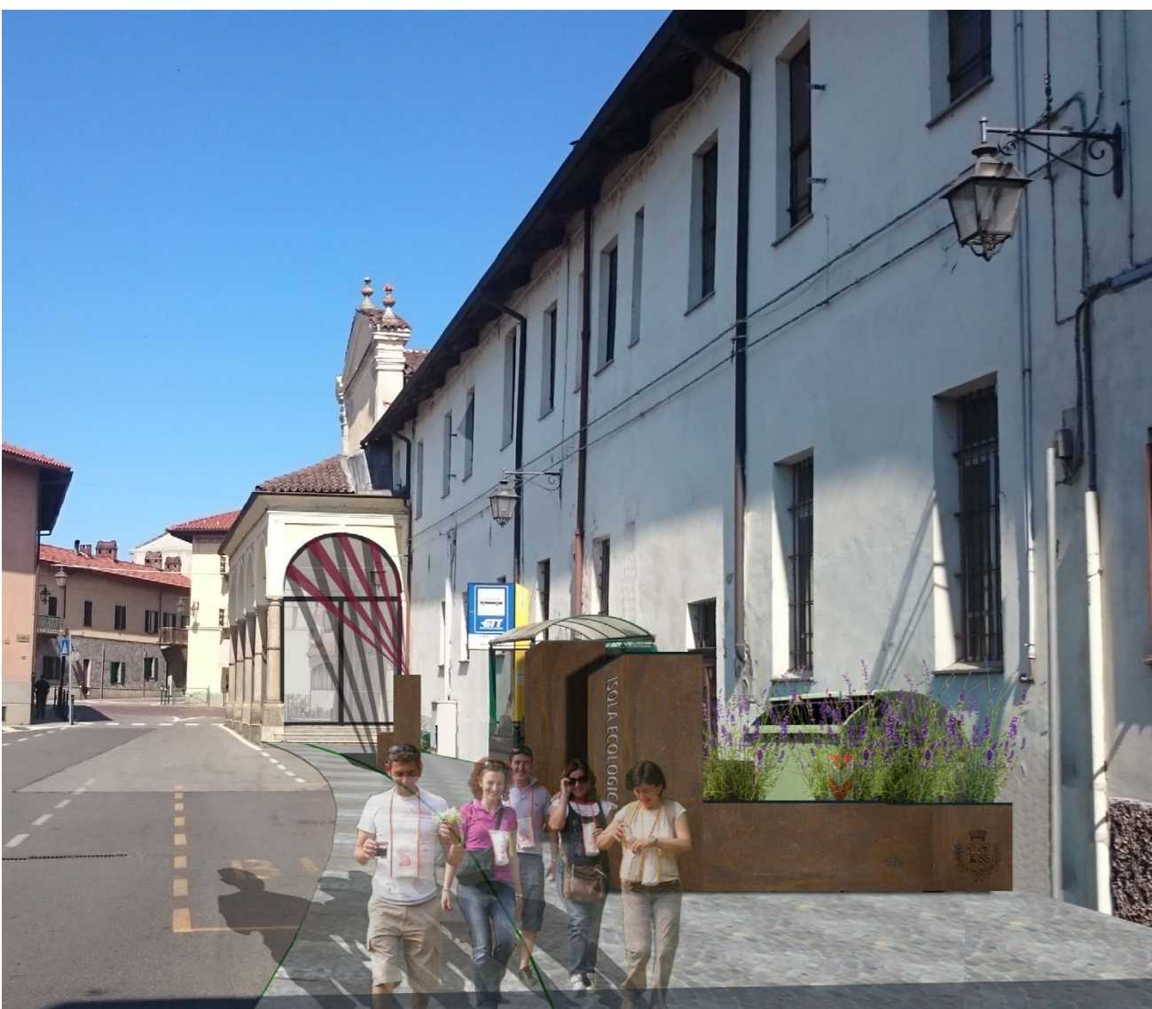
VISTA DELL'AREA SU VIA SAN FRANCESCO D'ASSISI