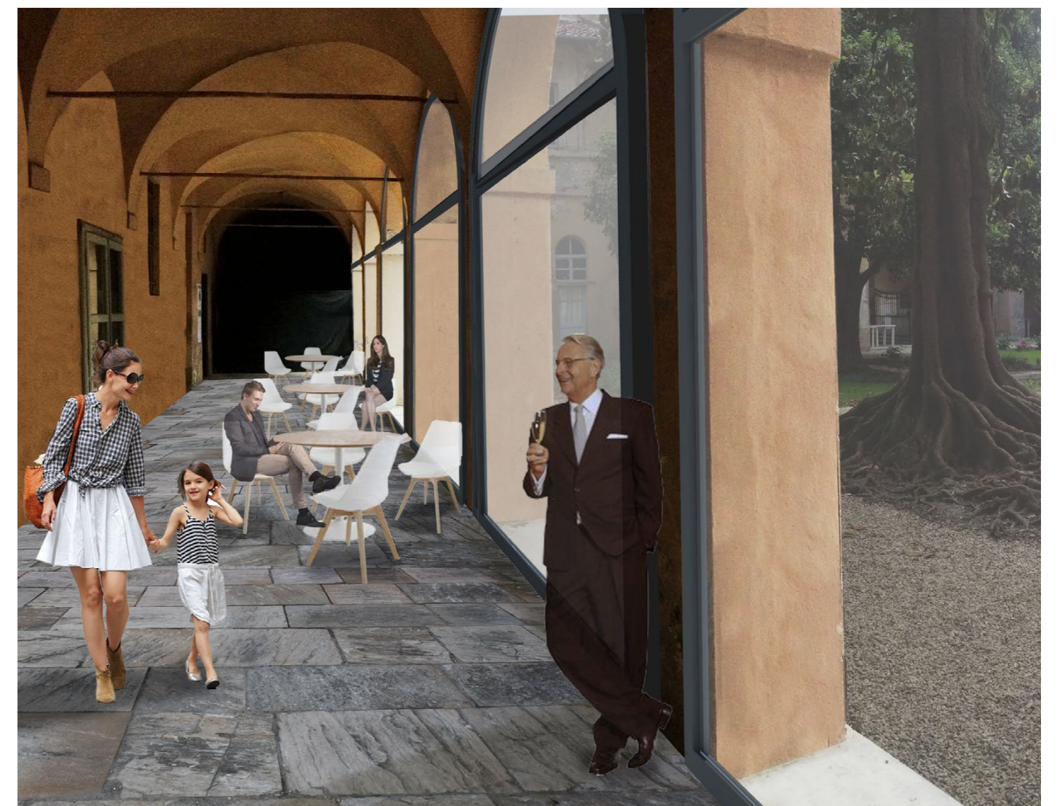
VISTA DEL CORRIDOIO COPERTO DELL'ALA NORD DALL'INTERNO