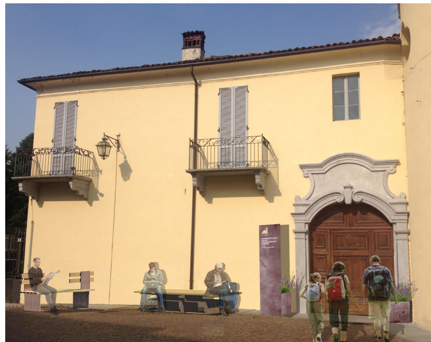
VISTA DELL'INGRESSO DEL CHIOSTRO DA PIAZZA MAZZINI