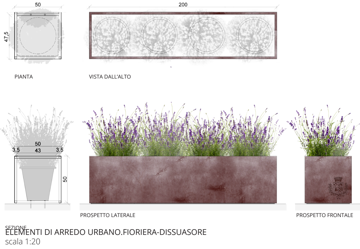
ELEMENTI DI ARREDO URBANO.FIORIERA-DISSUASORE scala 1:20