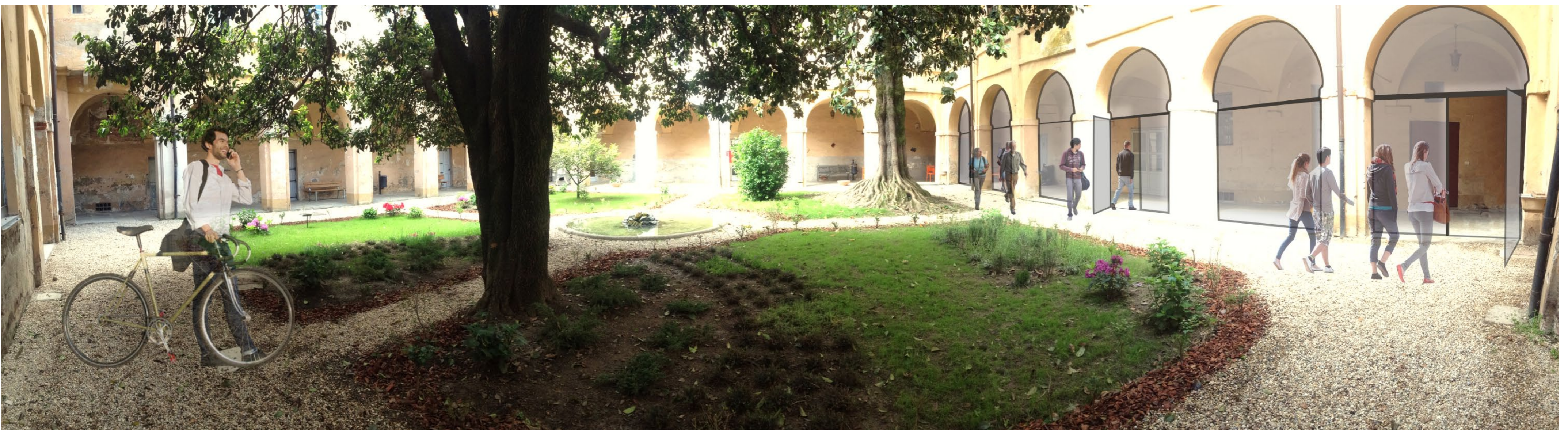
VISTA DELL'ALA OVEST E NORD DAL CORTILE INTERNO